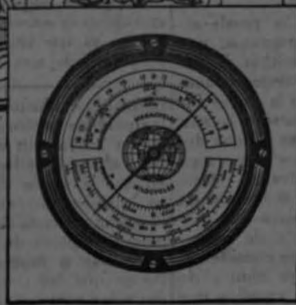
Nuevo Cuadrante Sintonizador RCA Victor de Visión Completa